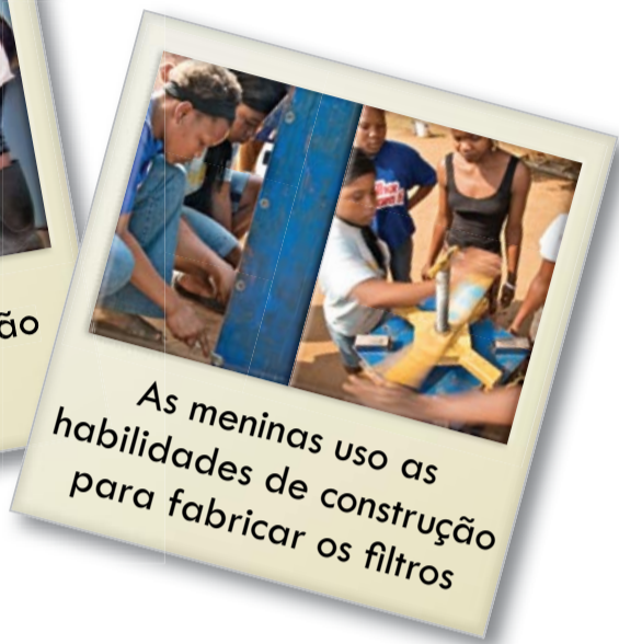
As meninas uso as habilidades de construção para fabricar os filtros

Os filtros lentos de areia eliminar quase todos os organismos que causam doenças na água: