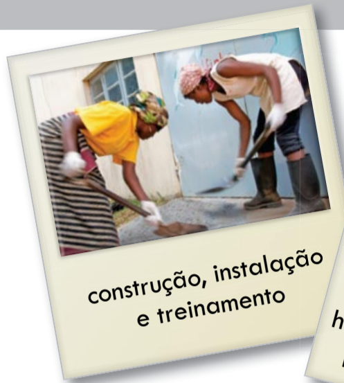
construção, instalação e treinamento